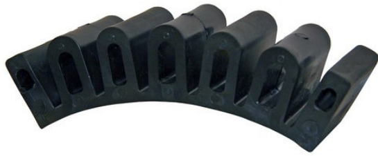
PE 100 elektroforankring, NRF-nr. 244 70 19

Elektroforankringen brukes ved forankring av PE trykkrør i betong. Kreftene fra røret overføres via elektroforankringene til betongveggen. Antallet som normalt er nødvendig per dimensjon og rørklasse finner du i tabellen under. Ved svært høye belastninger bør antallet beregnes. Forankringene er dimensjonert for en last på 42,3 kN per stk.